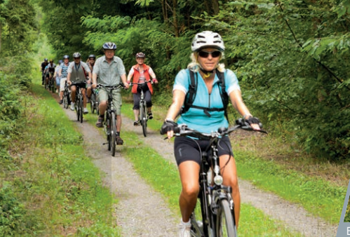
Blick ins Bottwartal