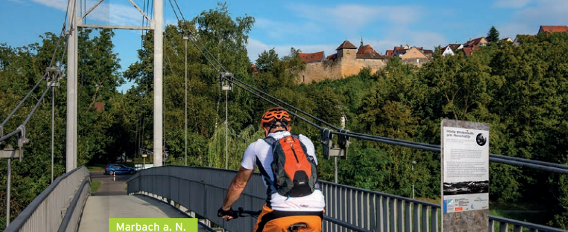
Marbach a. N.